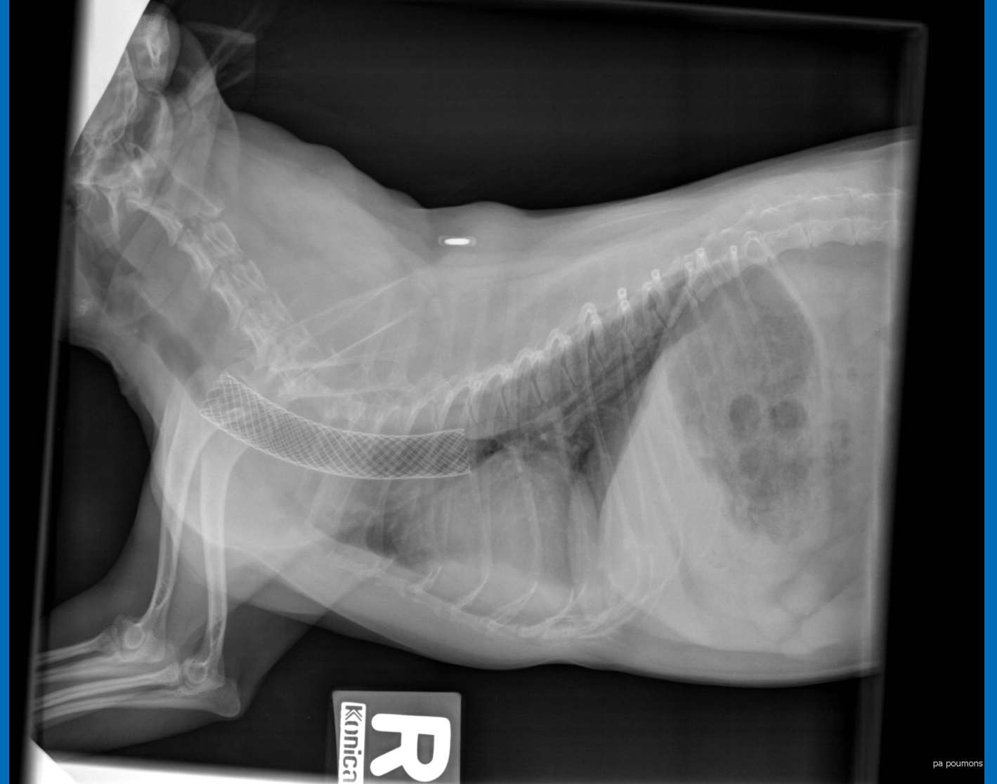
Radiographie - présence du stent trachéal